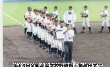
第103回全国高等学校野球選手権秋田大会

商品名: ワイド6切サイズ写真 大きさ: 約30cmx20cmの単写真大会名称が 入ります。